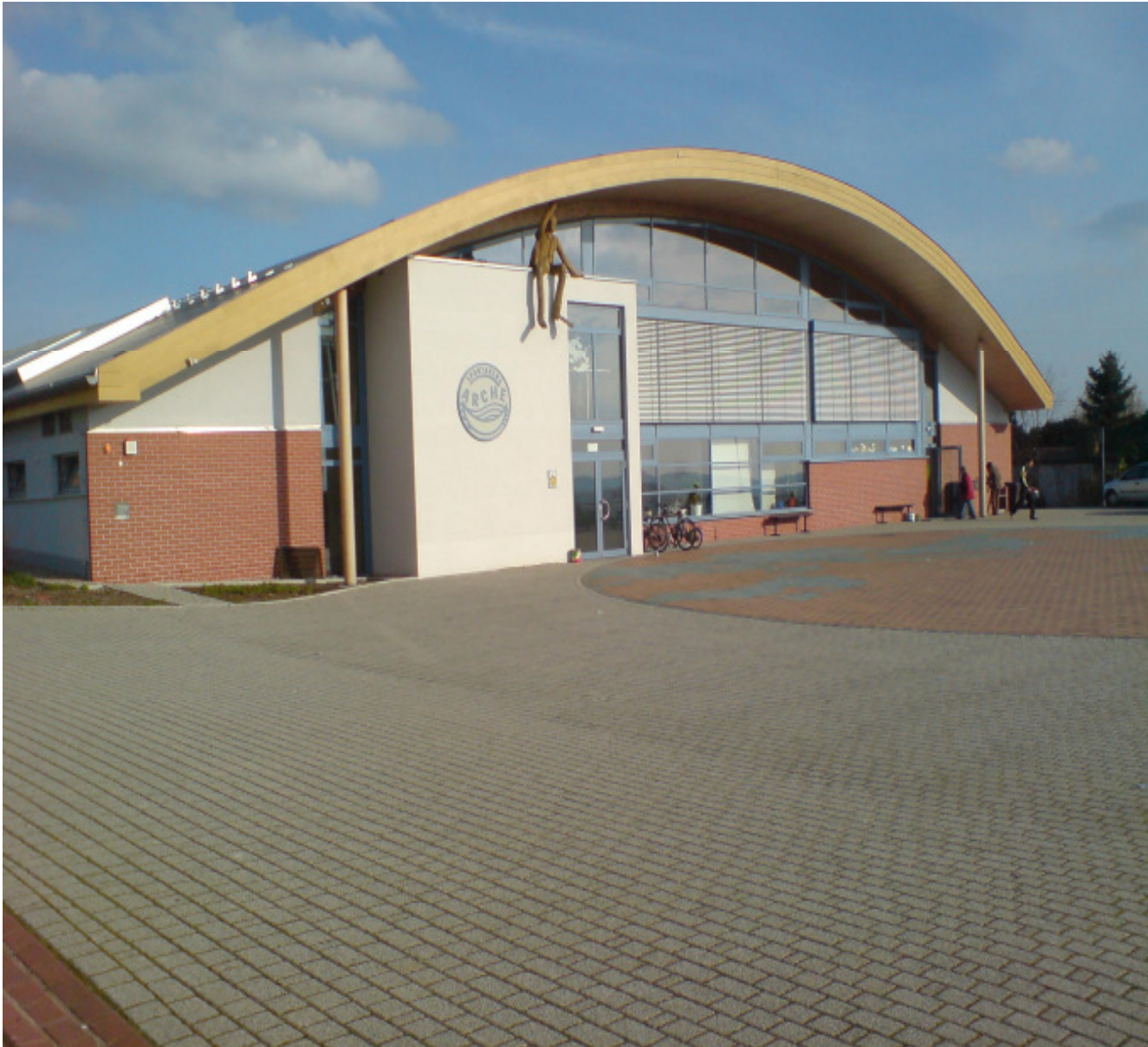
2 Feld Sporthalle