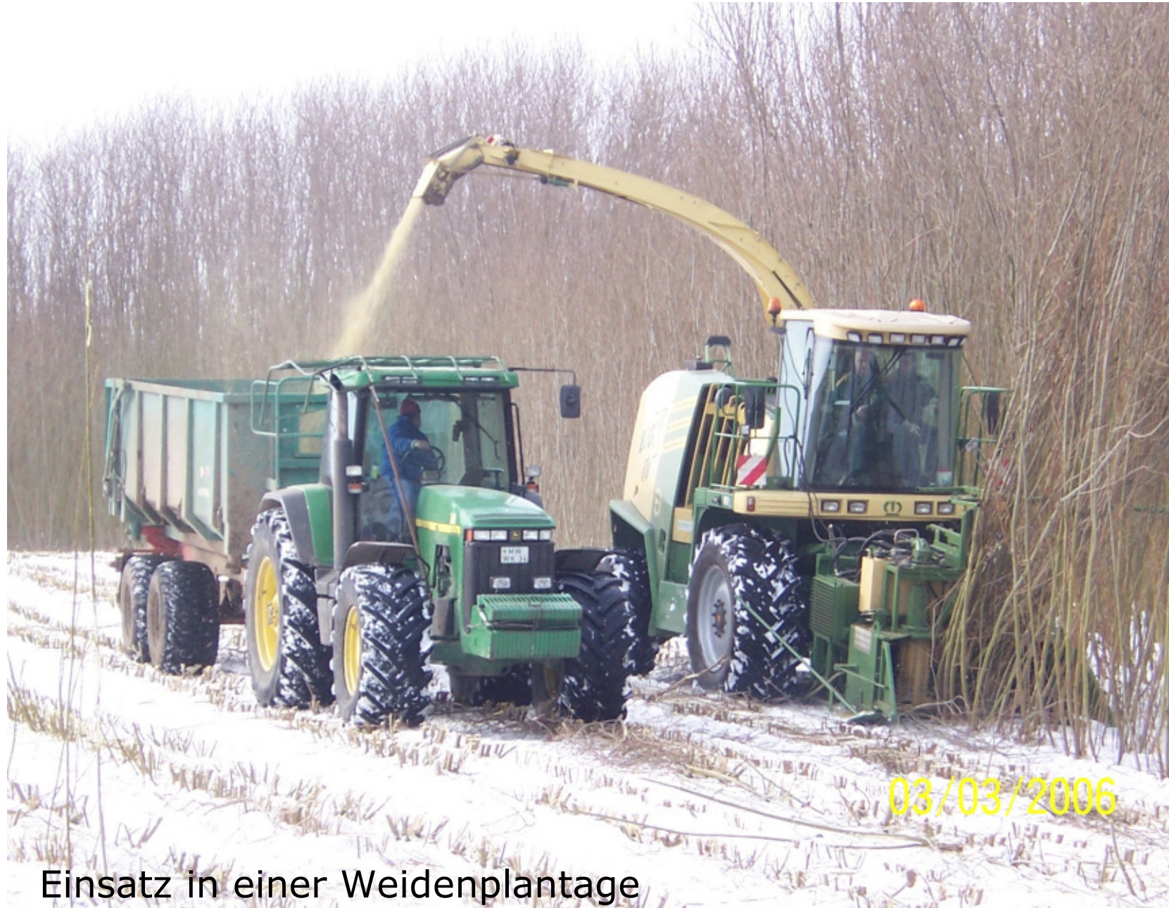
Einsatz in einer Weidenplantage